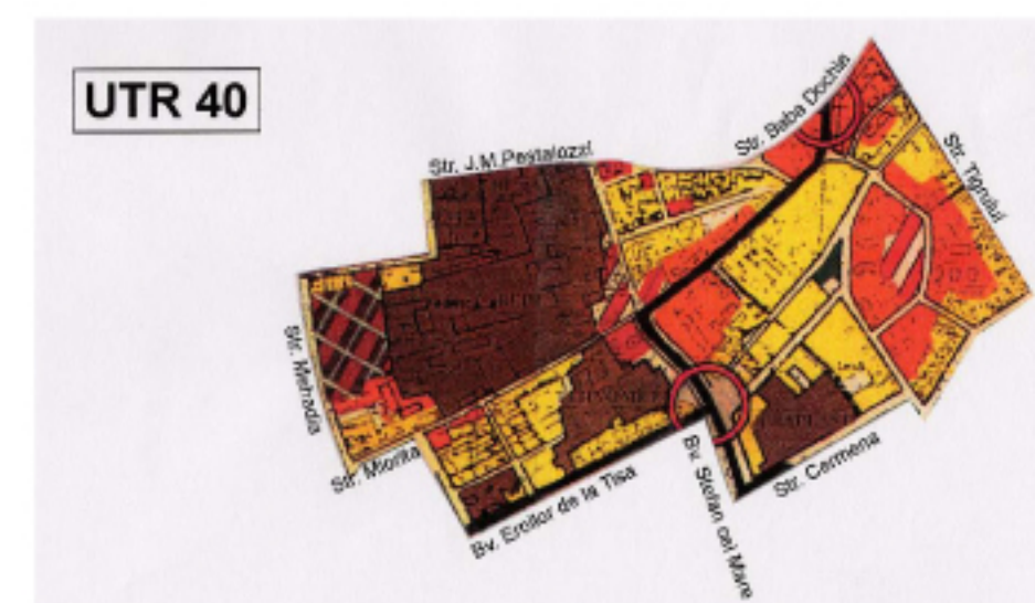
EXTRAS DIN P.U.G. TIMISOARA